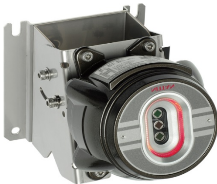
防塵防水型赤外線式3波長炎検知器