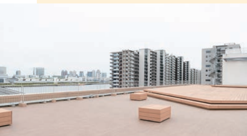
お台場を望む屋上はイベント会場にも使える