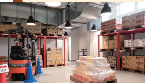
物流業務のデモ体験ができるスペースを備える