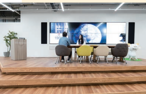
大きなモニターのある壇上は日頃の情報共有の場となっている

医薬品 をはじめとして、オロナミンC、ポカリスエットなど、一般消費者にも長く愛される商品でおなじみの大塚グループ。その物流を担う事業会社が大塚倉庫だ。45年前、大塚倉庫は徳島からの商品を荷揚げするため晴海ふ頭に倉庫を建てた。