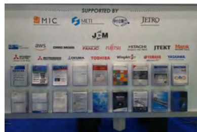
(※2019年サポーターロゴ掲示のボード)