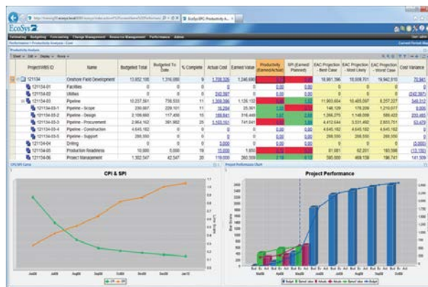
図 2: EcoSys ダッシュボード

EcoSys EPC で新設・改修・定修のプロジェクト・コストの透明性を高めましょう。分類ごとの予算、時々刻々と変化する情報から変更管理と正確な予測、そして発注実績や財務管理等の管理の見える化が行えます。また簡単なダッシュボード(図 2)により、成果測定レポート、矛盾や傾向分析、アワードバリュー分析などが簡単に行えます。また ERP や会計システム、スケジュール管理システムと連携することで、より効率的なコスト管理を行うことができます。